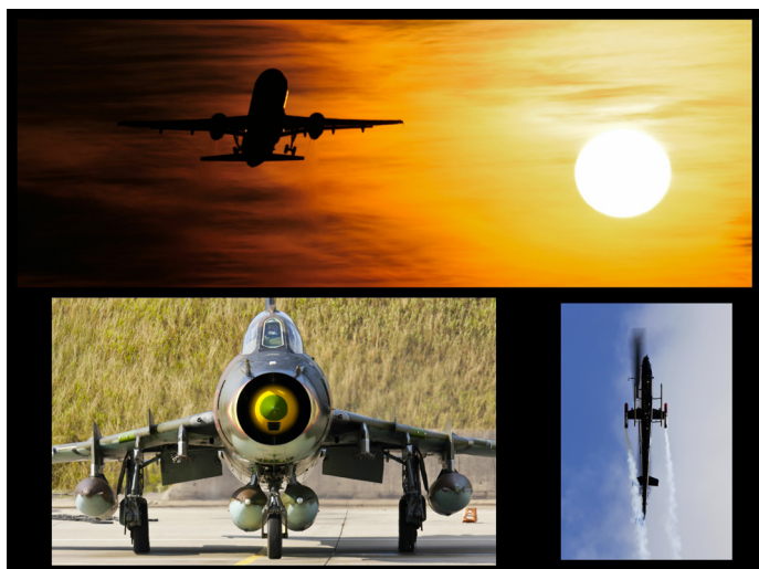
Wystawa Fotografii Lotniczej „BLIŻEJ NIEBA”