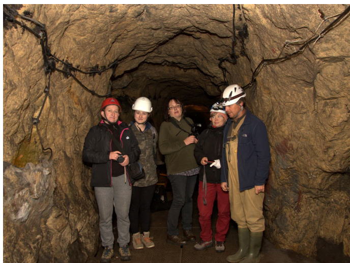
Na zdjęciu: członkowie grupy fotograficznej działającej w MGOK w Woźnikach.

Sztolnia Czarnego Pstrąga to najdłuższa w Polsce podziemna trasa turystyczna, którą turyści pokonują łodziami. Niestety nie wszyscy zachowują się pod ziemią wzorowo i wrzucają do wody różne rzeczy. Niektóre wraz z nurtem wpływają do roszy sztolni, a potem do rzeki, inne lądują na dnie. Podczas czyszczenia sztolni nurkowie wyłowili najróżniejsze przedmioty, m.in. grzebień, monety, portfele, telefony komórkowe itp. Znalaziska zostały sfotografowane, a dla tych kilku osób, które mogły obserwować nurków przy pracy było to niezapomniane doświadczenie.