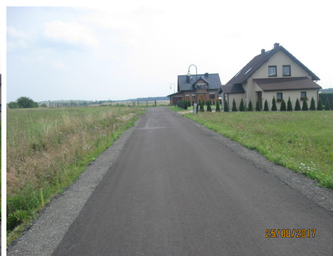
Dyrdy, Sośnica ul. Podleśna