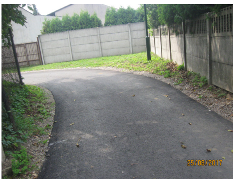
Drogi dojazdowe do Niw, Okrąglika i Czarnego Lasu