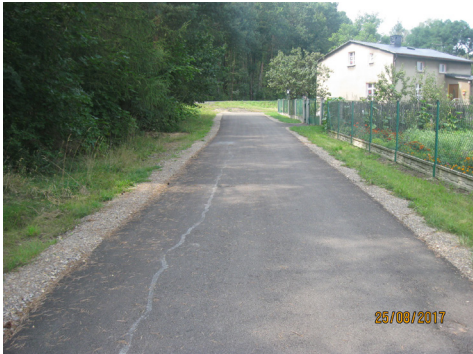
Piasek ul. Szkolna i ul. Strażacka