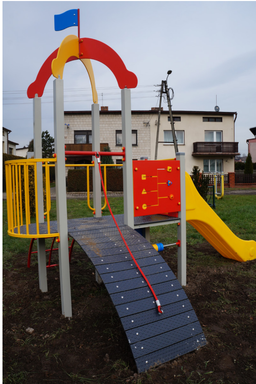
Na zdj. urządzenie wielofunkcyjne na placu zabaw na rogu ulic Harcerskiej i Kościuszki w Woźnikach

Woźniki • Czarny Las • Babienica • Dyrdy • Kamienica • Kamińskie Młyny • Ligota Woźnicka • Lubsza • Piasek • Psary