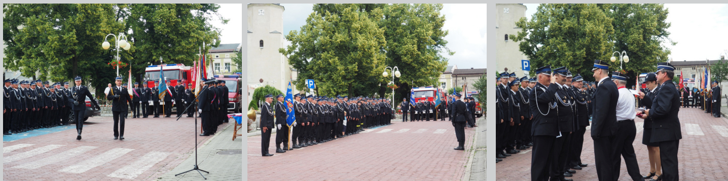
Zarząd OSP Woźniki

Organizatorzy pragną podziękować Sołectwu Dyrdy oraz Ochotniczej Straży Pożarnej w Kamienicy za udostępnienie namiotów, wszystkim artystom występującym na scenie, wystawcom, animatorom, pracownikom MGOK oraz druhom OSP Woźniki za wkład pracy włożony w przygotowanie festynu.