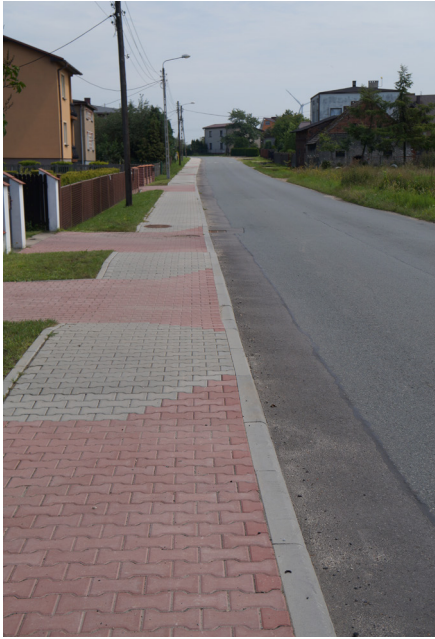
Budowa chodnika w Babienicy od ul. Stawowej w kierunku Kamienicy