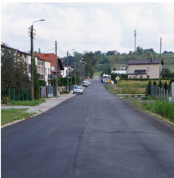
Remont ul. Kościuszki w Woźnikach