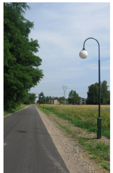
Wykonanie oświetlenia w Piasku