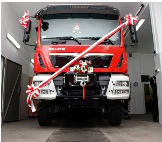
Zakup samochodu dla OSP Woźniki