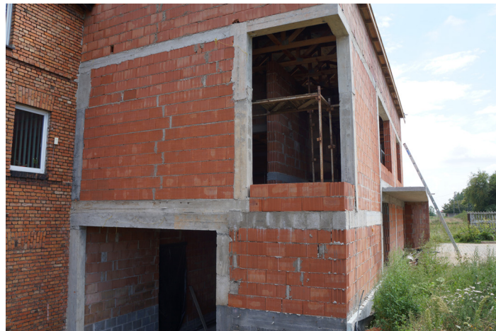
Wykonanie dokumentacji i rozbudowa budynku OSP w Lubczy Wartość inwestycji: 500 000,00 zł