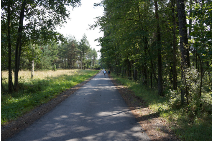
Wykonanie nakładki bitumicznej na ul. Podleśnej w Sośnicy