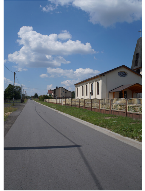
Budowa drogi ul. Tysiąclecia w Kamieńskich Młynach