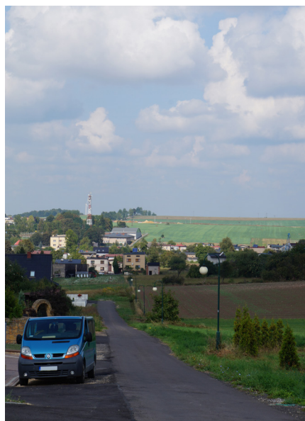
Wykonanie oświetlenia przy ul. Sadowej w Woźnikach