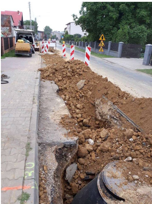
Przygotowanie dokumentacji i wykonanie kanalizacji w Ligocie Woźnickiej (realizacja ze środków ZIT)