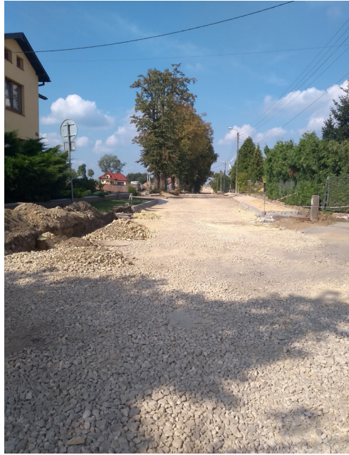
Budowa drogi ul. Lipowa w Psarach